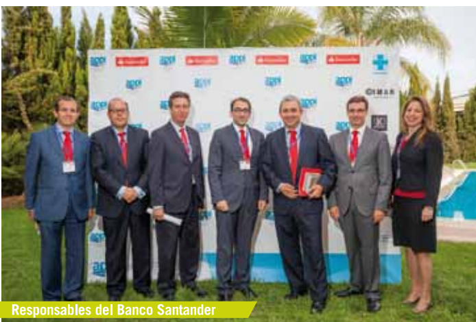
Responsables del Banco Santander

Si quiere ampliar la información de las ventajas contacte a través de info@appi-a.com