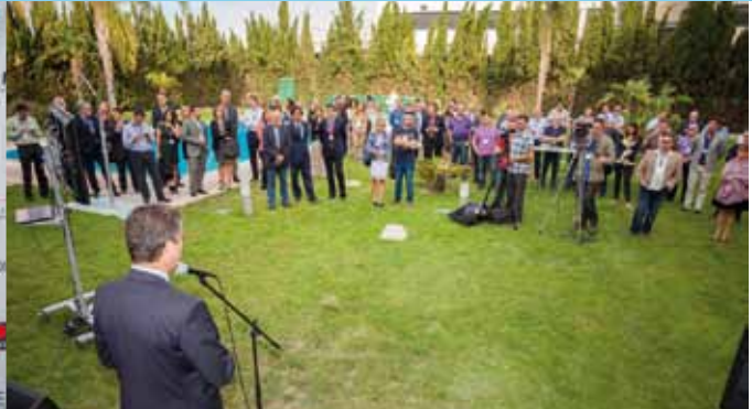
Vista general del acto de PRESENTACIÓN de la Revista de la APPI