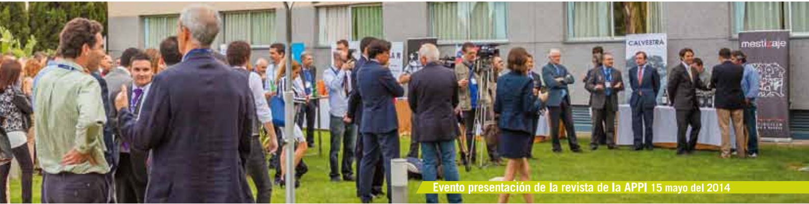
Evento presentación de la revista de la APPI 15 mayo del 2014