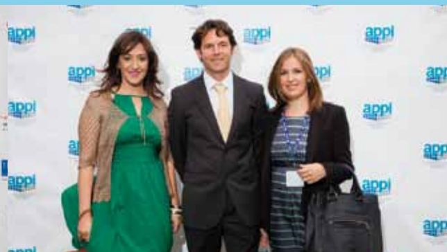
APPI PROVEEDOR El Presidente y la Gerente de la APPI con la Responsable de LARAINVEST