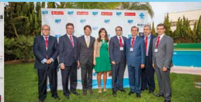
PATROCINADOR DEL EVENTO Responsables del BANCO SANTANDER