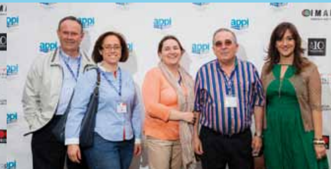
APPI PROVEEDOR Propietarios de las empresas GRÁFIQUES MACHÍ y TALLERES VILLAJOS; junto a la Gerente de la APPI